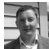
Etableringsvejledere for Ny Middelfart Kommune